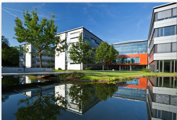
Hauptgebäude Goldbeck GmbH

Nach der ersten Schulung im Jahr 2011 wurden bisher mindestens 500 Goldbeck-Mitarbeiter aus den Bereichen Architektur, TGA-Planung und Systemplanung Halle durch die N+P unterrichtet. Zurzeit finden pro Monat durchschnittlich eine Architektur-Grundlagenschulung sowie alle zwei Monate die Basis-schulungen für TGA und Systemplanung Halle statt. Hinzu kommen die bedarfsweisen Angebote für die Aufbauseminare. In Summe kann man die Zahl der geschulten Personen allein im letzten Jahr auf ca. 200 beziffern. Dabei spielt nicht die Quantität die Hauptrolle. „Wir legen sehr viel Wert auf Qualität. Schon seit Jahren führt die N+P die Schulungen in unserem Hause durch – mit fantastischen Ergebnissen. Wir arbeiten sehr vertrauensvoll und erfolgreich zusammen“, so Mark Jäckel, Leiter BIM bei Goldbeck.